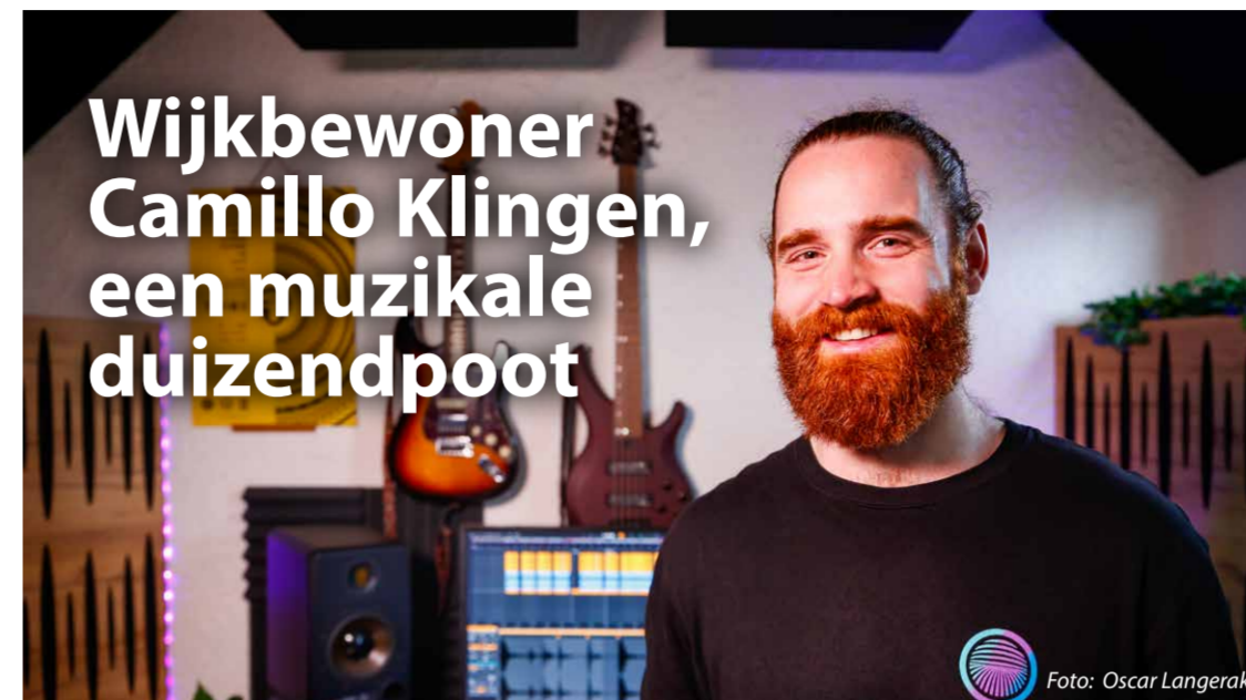
Door Sandra Degen