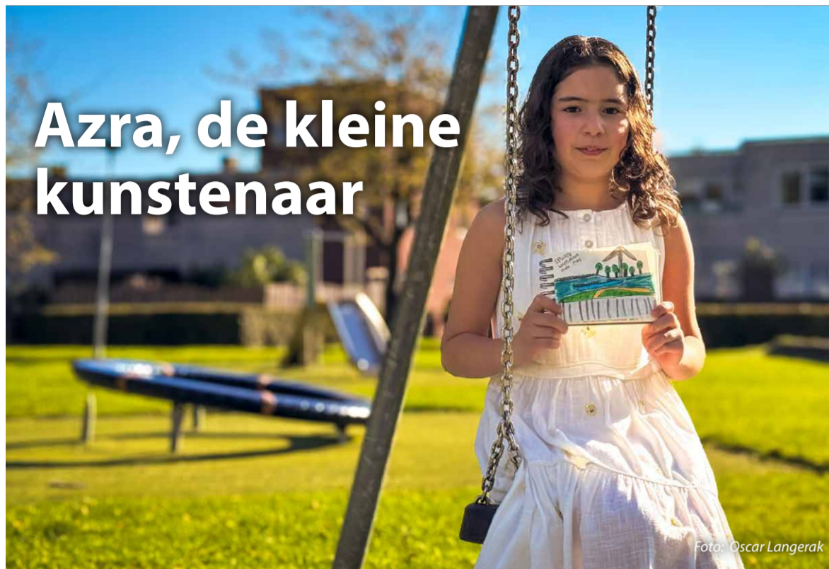
Door Anne-Rixt Korte